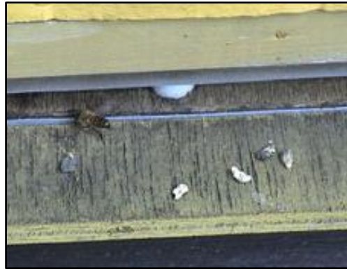
Kalkyngel smidt ud af stadet