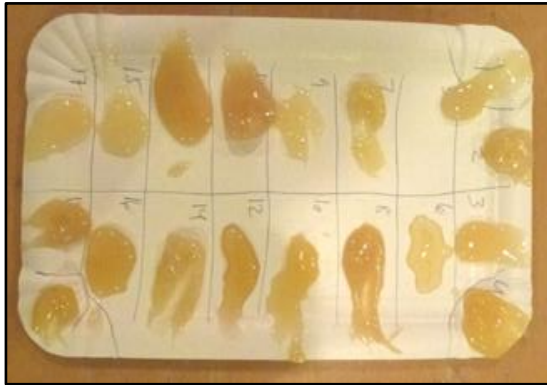
En honningtavle der skal smages igennem af deltagerne på generalforsamlingen.

Hvert år ved generalforsamlingen kårer vi Birkets bedste honning. Ved seneste generalforsamling kårede vi desuden en nr. 2 og nr. 3.