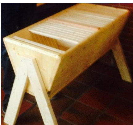
Det krybbeformede afrikanske bistade,

Foreningen har givet sig selv et afrikansk bistade i jubilæumsgave.