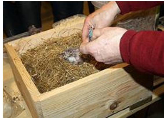
Humblebo-trækasse fores med tørret græs og mos.