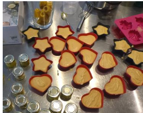
Sæber i forme. Fra sæbekurset.

fabrikant, der har det på lager i store mængder og er villig til at sælge i små portioner. Så snart skal vi også til at teste dette.