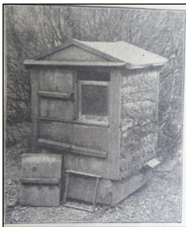
Et af C.Jensens Lavstader til 4 Familier

Honninghøsten var af stor betydning, for et godt bifolk kunne give en årlig indtægt på 15-20 kr. Det var derfor almen kendt, at man selv måtte hjælpe til for at få vredet så meget honning ud af familierne som muligt. At klemme dronningen i begyndelsen af trækket for at forhindre, at der ved trækkets slutning skulle findes "for mange Ædere" i staderne var en af metoderne. Det betød så, at stadet kunne tømmes til sidste dråbe honning, men at familien ikke var stor ved indvintring. Nogle stader havde ikke fået lavet sig en ny dronning, så alt i alt mentes denne metode at være meget risikabel! En anden metode var at begrænse antal tavler i yngellejet. Et forsøg med kun 8 yngeltavler fra 1. juni i 13 stader gav 9 pund honning mere pr. stade end de 12 stader, som ikke blev begrænset. Selv denne, i mine øjne, begrænsede forskel syntes dengang at være værd at regne med i dårlige honningår. Biavleren havde gjort det over en årrække, og syntes det var det værd.