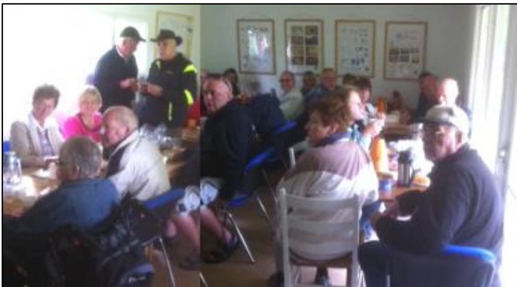
Med lidt fotoklip kan vi vise at klubhuset var fyldt op med biavlere, kaffe og kage.