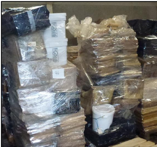
Mange rammer i mange lag

mærker både på rammerne og på yderste pose. Og at vi skal skrive med kuglepen og ikke en gnidret blyant. Men ikke mindst skal rammerne pakkes bitæt.