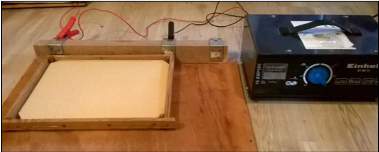
Har du en bilbatterilader er det nemt at lave et billigt ilodningsapparat.

rammen. Derved smeltes vokstavlen omkring tråden. Man lærer sig at trække rammen væk efter passende 3-5 sekunder før tavlen smeltes helt igennem. Voksen stivner med det samme og tavlen sidder fast.